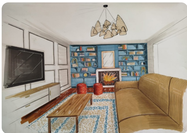
Réalisations à main levée par Cindy

Instagram – facebook : @douxcocondecoration