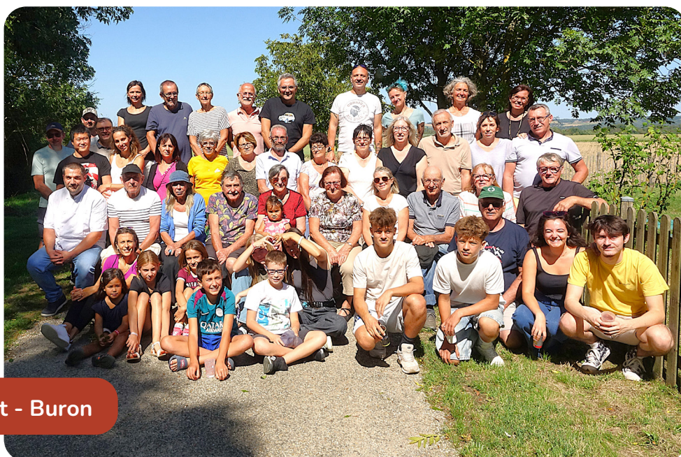
Brachet - Buron